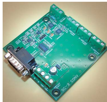
20チャンネルセンサー回路 (レベルコンバーター基板)

平成21年度ものづくり中小企業製品開発等支援補助金（試作開発等支援事業）にて試作開発したものです。