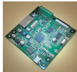
センサー回路 (デジタル基板)