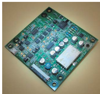
センサー回路 (アナログ基板)